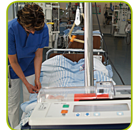
Eine Anästhesieschwester schließt im Aufwachraum eine Schmerzpumpe an.

Dieses Verfahren ermöglicht Ihnen, sich selbst im richtigen Augenblick über eine elektronisch gesteuerte Pumpe ein hochwirksames Schmerzmittel zu verabreichen. Diese Pumpe wird so programmiert, dass eine Überdosis ausgeschlossen ist. Sie selber können also genau bestimmen, wann, wie viel und wie oft Sie das Schmerzmittel erhalten.