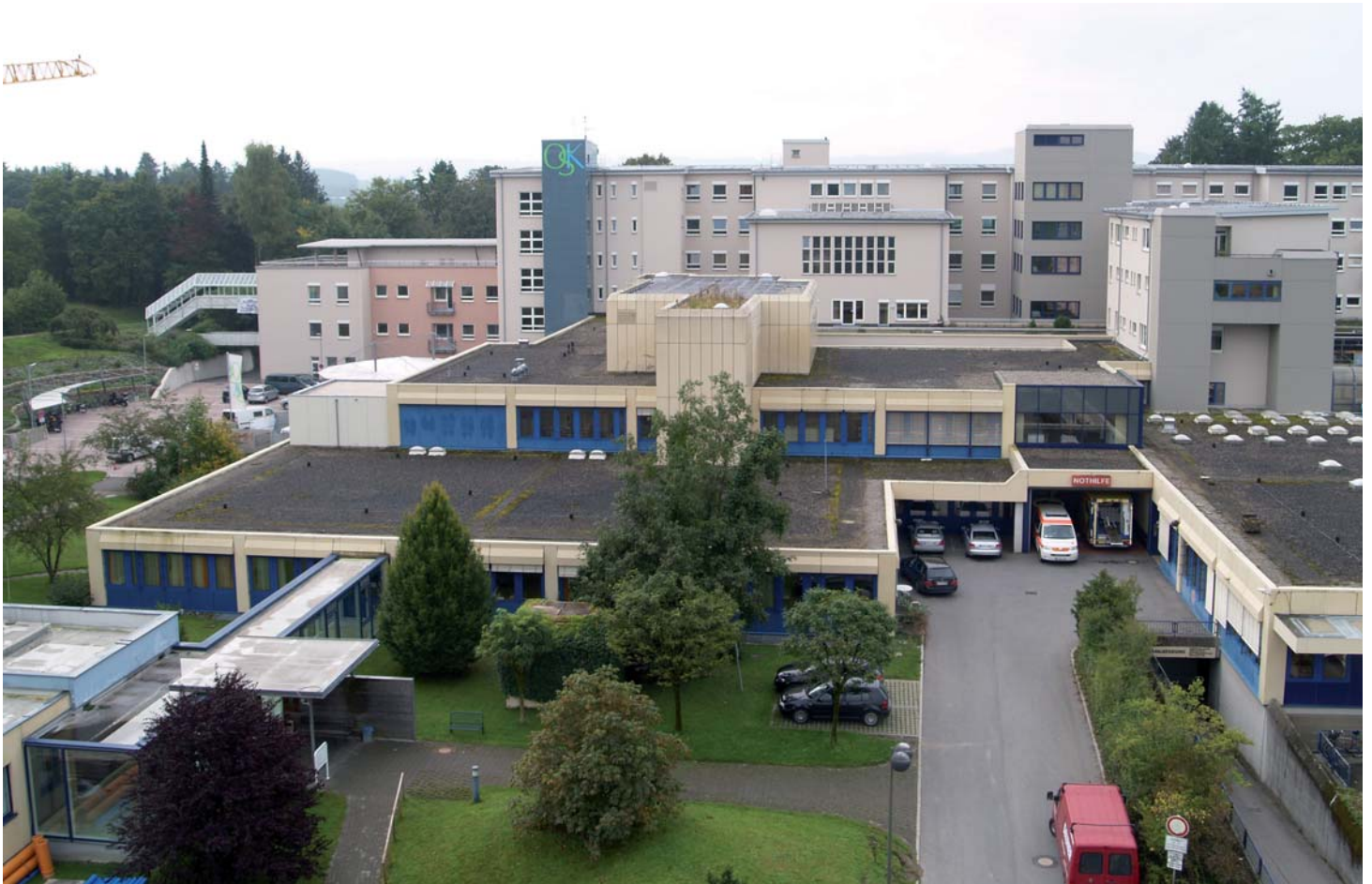
Das Krankenhaus Wangen: modernisiert und von der Uni Ulm zum Akademischen Lehrkrankenhaus ernannt.